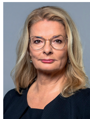
Lotta Edholm (L) Skolminister Utbildningsdepartementet