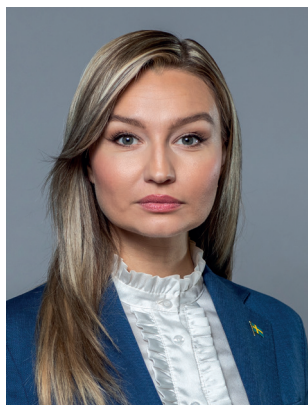
Ebba Busch (KD) Energi- och näringsminister och vice statsminister Klimat- och näringslivs- departementet