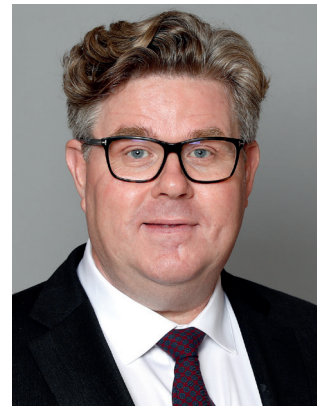
Gunnar Strömmer (M) Justitieminister Justitiedepartementet