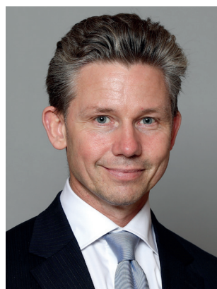
Pål Jonson (M) Försvarsminister Försvarsdepartementet