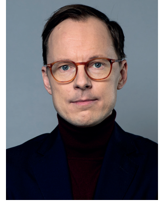
Mats Persson (L) Utbildningsminister Utbildningsdepartementet