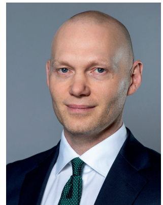
Niklas Wykman (M) Finansmarknadsminister Finansdepartementet

Sverige styrs av en regering bestående av Moderaterna (M), Kristdemokraterna (KD) och Liberalerna (L). Den 18 oktober 2022 tillträdde en regering med Ulf Kristersson (M) som statsminister.