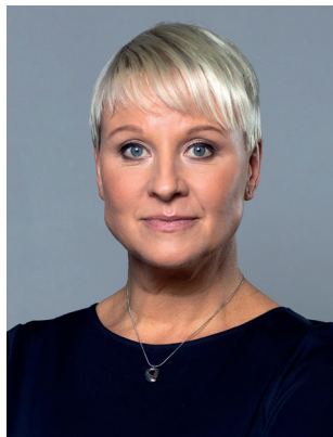
Anna Tenje (M) Äldre- och socialförsäkrings- minister Socialdepartementet