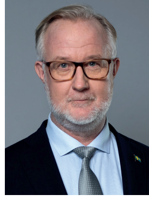
Johan Pehrson (L) Arbetsmarknads- och integrationsminister Arbetsmarknadsdeparte- mentet