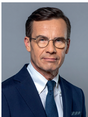
Ulf Kristersson (M) Statsminister Statsrådsberedningen