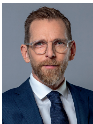
Jakob Forssmed (KD) Socialminister Socialdepartementet