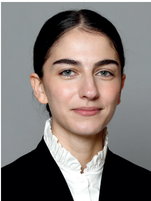
Romina Pourmokhtari (L) Klimat- och miljöminister Klimat- och näringslivs- departementet