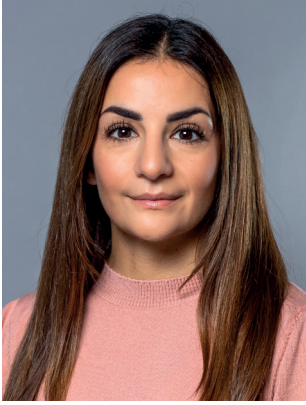
Parisa Liljestrand (M) Kulturminister Kulturdepartementet