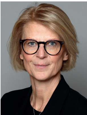
Elisabeth Svantesson (M) Finansminister Finansdepartementet