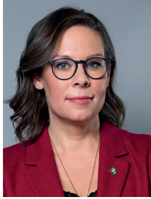
Maria Malmer Stenergard (M) Migrationsminister Justitiedepartementet