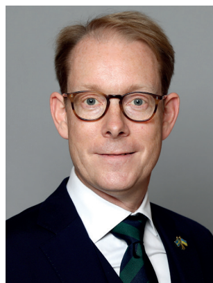
Tobias Billström (M) Utrikesminister Utrikesdepartementet