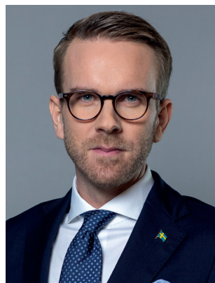
Andreas Carlson (KD) Infrastruktur- och bostads- minister Landsbygds- och infrastruktur- departementet