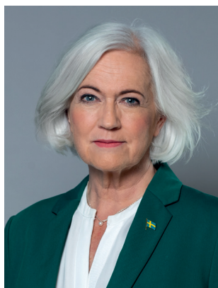
Acko Ankarberg Johansson (KD) Sjukvårdsminister Socialdepartementet