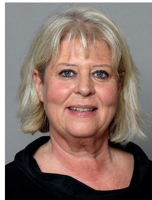
Camilla Waltersson Grönvall (M) Socialtjänstminister Socialdepartementet