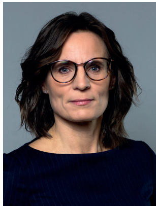
Jessika Roswall (M) EU-minister Statsrådsberedningen