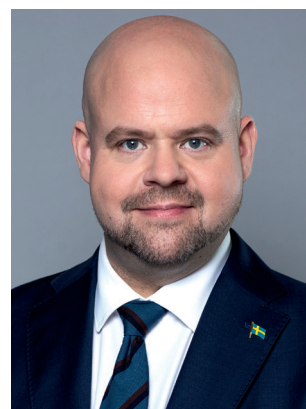
Peter Kullgren (KD) Landsbygdsminister Landsbygds- och infrastruktur- departementet