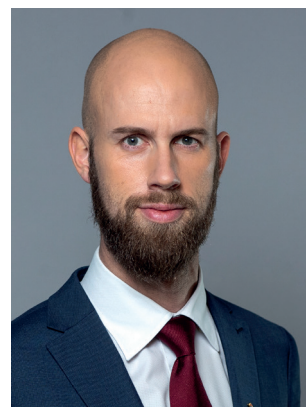
Carl-Oskar Bohlin (M) Minister för civilt försvar Försvarsdepartementet