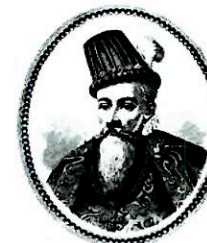
Redan år 1585 grundade Johan III Härnösand. Sedan 1645 är staden residensstad.

Härnösands långa tradition av förvaltning fick sin form under den tid då Axel Oxenstierna indelade landet. Förvaltningstraditionen, kombinerad med en välutvecklad stödjande omgivning anpassad för offentlig verksamhet, gör att vi lever upp till de krav som ställs på effektivitet och kvalitet.