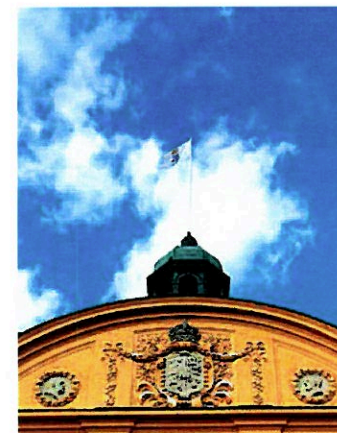
Gamla landstamhuset, länsstyrelsens nuvarande huvudbyggnad, uppfördes 1908-1910. Byggnaden pryds av reliefer av både Oscar II och Gustaf V.

människor trivs och har möjlighet att utvecklas. Härnösand är en stad som växer för framtiden.