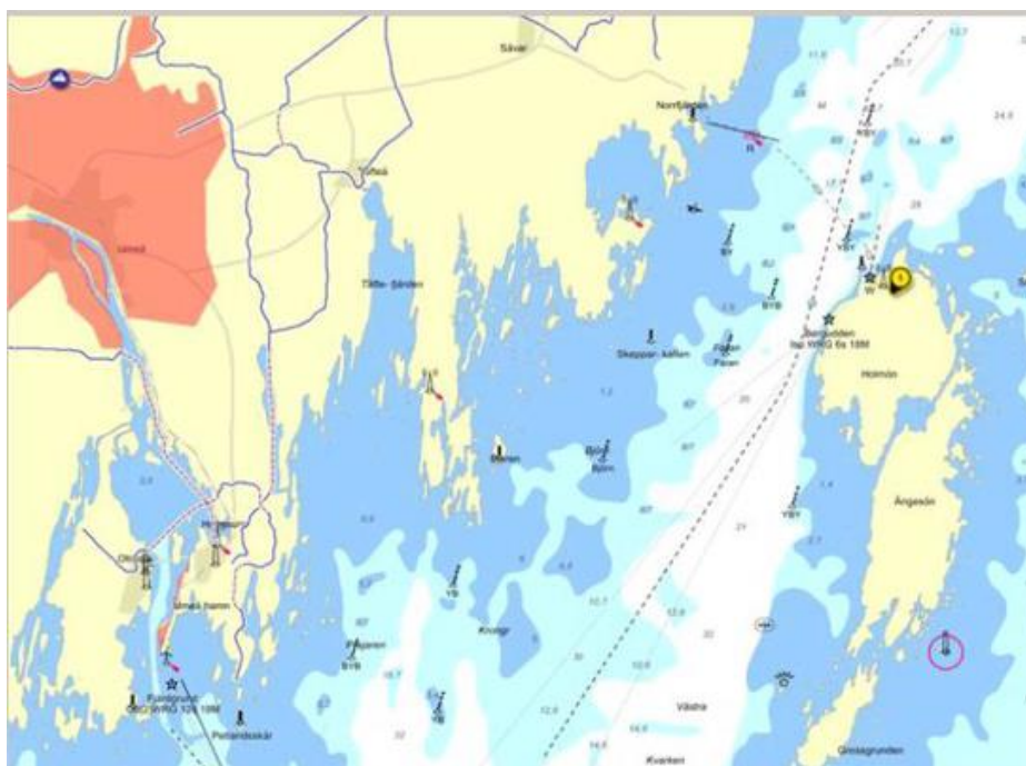
Fig: Karta över Holmöleden.

Svåra trafikeringsförhållanden råder främst under höst och vinter i samband med isbildning (0-20cm), förfalltid, isvallar mm. Under vissa tider av året kan det vara under besvärliga väderförhållanden med stark vind på öppet hav då Capella ligger med oskyddad akter i hamnen på Holmön. Vintertid med svåra isförhållanden där istjockleken ett normalår kan uppgå till 30-50 cm. Dessutom kan det lätt bildas isvallar av sammanpackad drivis.