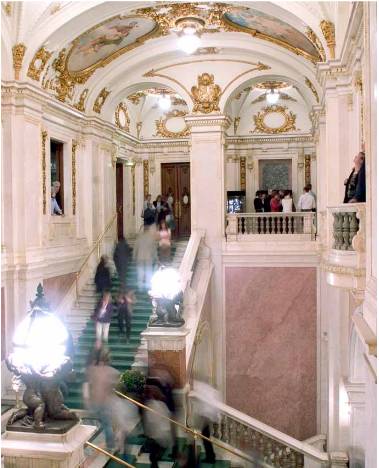
Den vackra entrétrappan i Kungliga Operan i Stockholm – Sveriges nationalscen för opera och balett sedan den 18 januari 1773, då den första föreställningen gavs i Gustav III:s operahus.