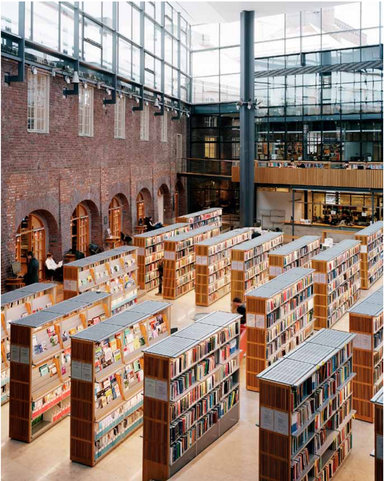
Biblioteket på KTH, Kungliga Tekniska Högskolan i Stockholm. KTH är ett av många campusområden i Sverige som ägs och förvaltas av Akademiska Hus. Runt 300 000 personer studerar, forskar och arbetar varje dag i någon av Akademiska Hus fastigheter.