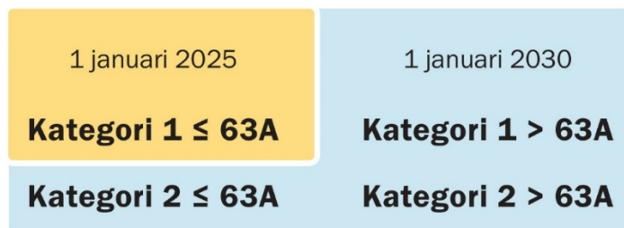
Figur 2 Olika införandetid för olika mätarkategorier

Förslaget innebär i korthet att elmätare av kategori 1 i en uttagpunkt med en säkring om högst till med 63 A ska uppfylla kraven senast den 1 januari 2025. Övriga mätare som omfattas av regleringen ska uppfylla kraven senast den 1 januari 2030, om inte kunden begär att funktionskraven ska vara uppfyllda tidigare. I Figur 2 visas en illustration av de olika tidpunkterna som föreslås för införande av olika kategorier av elmätare ska uppfylla funktionskraven.