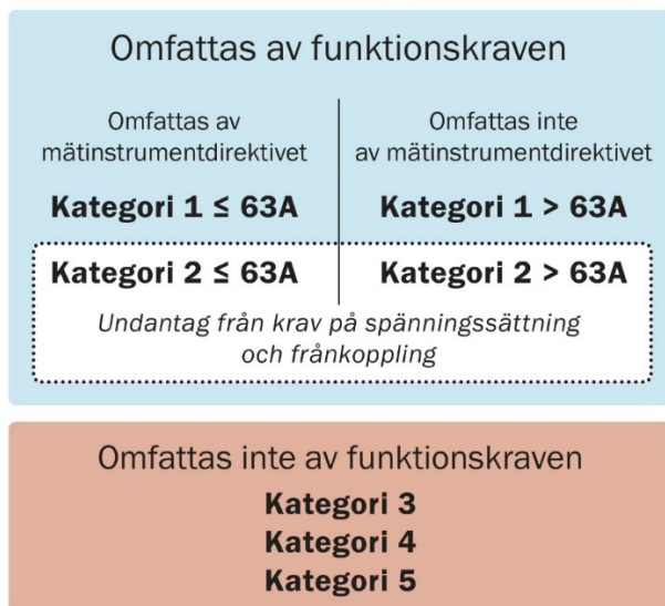
Figur 1 Olika indelningar av elmätare i kategorier i relation till funktionskravens föreslagna omfattning