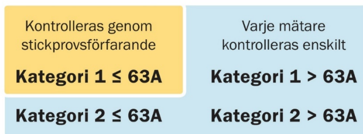
Figur 3 Olika förfaranden för kontroll och installation för olika mätare

Mätare av kategori 1 upp till och med 63 A byts i regel ut i stora volymer samtidigt. Dessa elmätare kontrolleras via stickprovsförfarande, vilket innebär en statistisk kontroll där inte alla mätare behöver kontrolleras enskilt utan det räcker att ett parti av mätare kontrolleras och då representerar en större grupp. För elmätare av kategori 1 över 63 A samt mätare av kategori 2 måste istället varje enskild mätare kontrolleras vart sjätte år. Kategori 2 måste dessutom kontrolleras på plats ute i fält vart sjätte år samt innan de tas i drift. Detta illustreras i Figur 3. Eftersom det finns ett begränsat antal specialister som kan göra dessa kontroller och installationer byts dessa mätare ut löpande, istället för att ett stort antal mätare byts ut på en och samma gång.