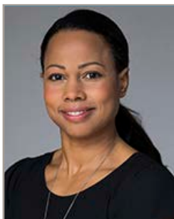
Alice Bah Kuhnke Kultur- och demokratiminister

I den här skriften finns information om vad regeringens strategi för romsk inkludering är och om det arbete som nu genomförs. Min förhoppning är att den kan vara till hjälp för romer och andra aktörer som vill delta i arbetet. Målet kommer att nås tillsammans.