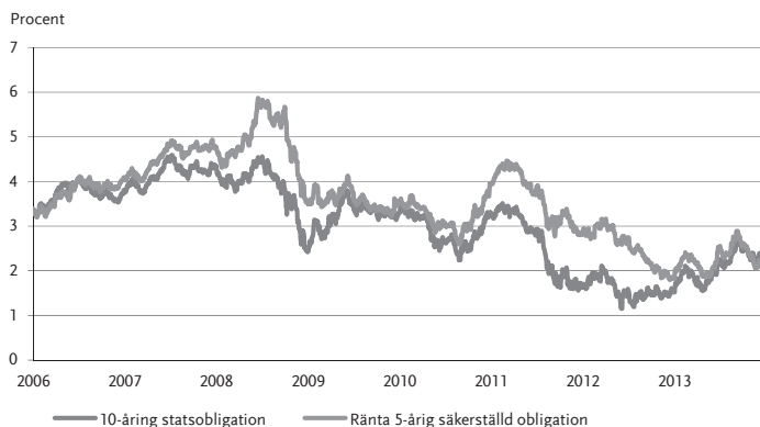
Diagram 1 Ränteutveckling 2006–2013