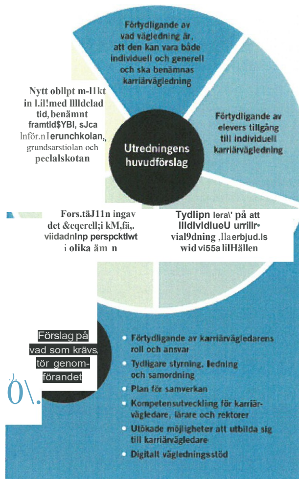
Figur 10.1 Utredningens huvudförslag och förslag på vad som krävs för genomförande

Svar: Olofströms kommun instämmer att det är viktigt att anta och bibehålla ett helhetsgrepp samt implementera de förändringar som det beslutas om.