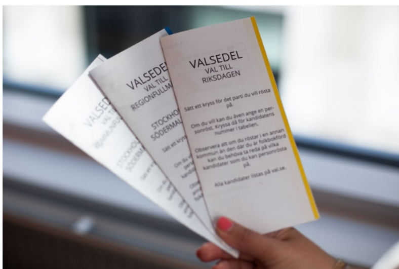
Förslag på hur valsedlar för valen till riksdag, region- och kommunfullmäktige kan se ut. Valsedlarna behöver inga kuvert, utan de viks i tre delar och stoppas sedan i valurnan.

Om det är färre valsedlar som är SOU 2026:2 yttersta syfte så lär 2023 års förslag från Valmyndigheten spara in på ännu fler valsedlar. Valmyndighetens förslag skulle även innebära att inga kuvert behövs, då valsedeln viks i tre delar innan man stoppar ned den i valurnan. Förenklar även vid rösträkning. Bilden nedan från Valmyndighetens hemsida.