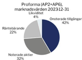
Diagram 2 nedan visar en beräknad proformabalansräkning 2025 utifrån avkastningsförväntan i tabell 1. En vanligt förekommande förväntad avkastning för Private Equity är 18 %. I denna beräkning används ett mer konservativt antagande om 15%.

Diagram 1 nedan visar en proformabalansräkning per december 2023 för Andra och Sjätte AP-fonden