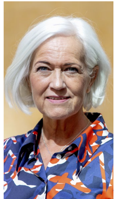
Acko Ankarberg Johansson, sjukvårdsminister

Det handlar också om att säkerställa sjukvårdens förmåga att ta hand om exempelvis plötsliga och ökade patientflöden i en sådan situation. Sverige ska ha tillräckliga lager av läkemedel och medicintekniska produkter för att klara en kris.