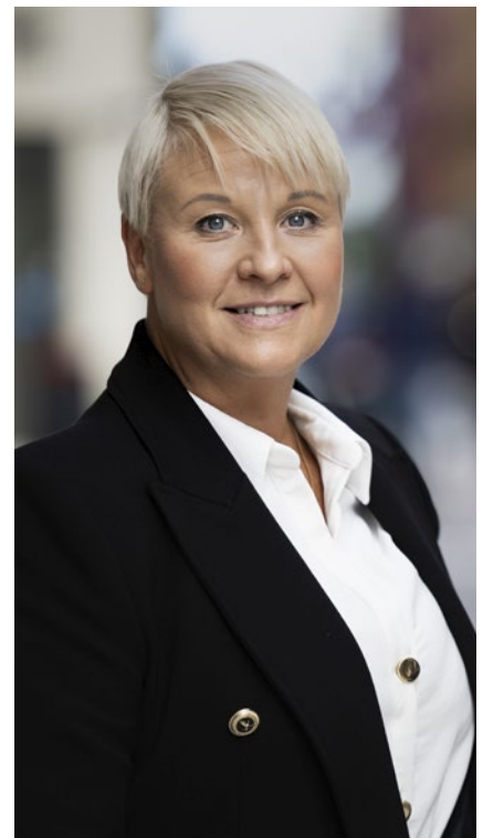
Anna Tenje, Äldre- och socialförsäkringsminister

Äldreomsorg handlar om insatser för att säkerställa trygghet och förbättra livskvaliteten för de äldre. Målet för äldreomsorgen är att äldre ska kunna leva ett aktivt liv och ha inflytande i samhället och över sin vardag. Äldre ska kunna åldras i trygghet, ha kvar sitt oberoende och bemötas med respekt. De ska ha tillgång till god vård och omsorg.