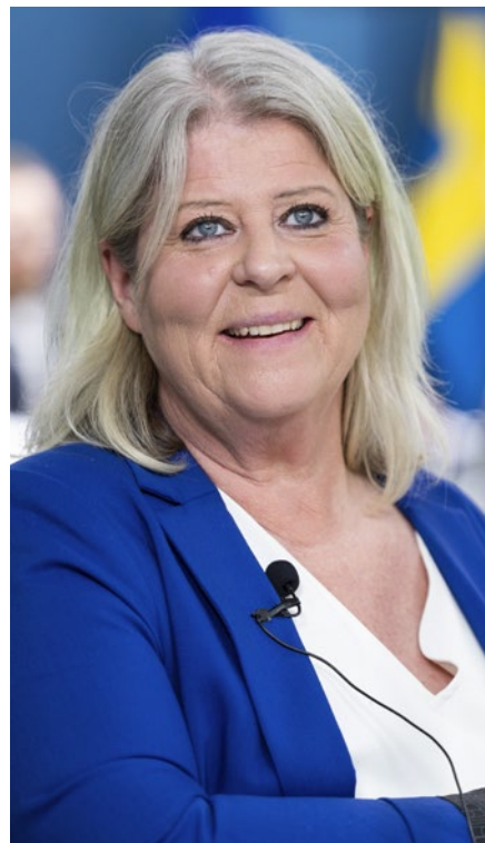
Camilla Waltersson Grönvall, socialtjänstminister

mot barn som växer upp i hem med missbruk eller psykisk ohälsa och att stödja kommunerna i deras arbete inom den sociala barn och ungdomsvården är också prioriterat av regeringen.