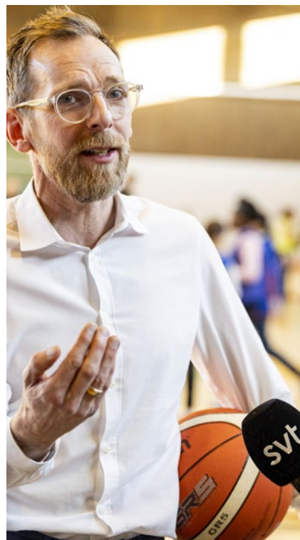
Jakob Forssmed, socialminister

Idrottspolitikens mål är att ge möjligheter för flickor och pojkar, kvinnor och män att motionera och idrotta för att främja en god folkhälsa, att stödja en fri och självständig idrottsrörelse samt att ge flickor och pojkar, kvinnor och män positiva upplevelser av idrott som underhållning.