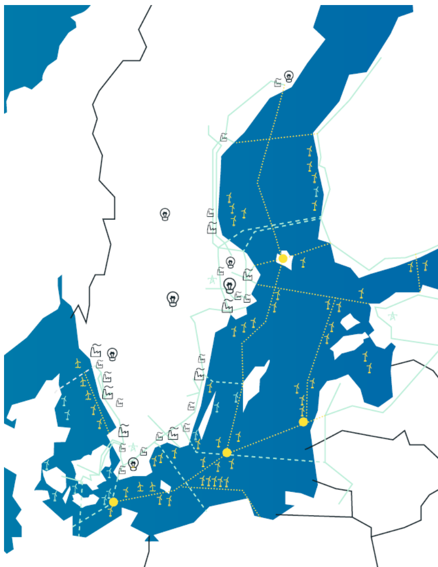
Bild från ”Strategisk innovationsagenda för vindenergi och elnät till havs”

”Green Stream” skapar ett scenario där havsbaserad vindkraft får en ambition att anpassa kostnader till priset på den nordiska elmarknaden. Denna ytterligare kostnadsreduktion kan inte andra länder bekosta, det är något Sverige själv måste utforma. Här finns det en enorm chans till industriutveckling i Sverige. Regionerna är villiga att forma och stötta denna långsiktiga näringslivsutveckling. Sveriges kunnande inom elteknik, vindenergi, maritim teknik och logistik är nyckelfaktorer för denna exportprodukt – kombinationen av befintlig kunskap och erfarenhet, applikation av intelligens och digitalisering för såväl logistik, drift och underhåll samt produktionsprognos – gör den snabba omställningen till förnybar energi inom europeiska Energiunionen möjlig, reducerar riskerna i elsystemet och ökar försörjningstryggheten i vår del av Europa.