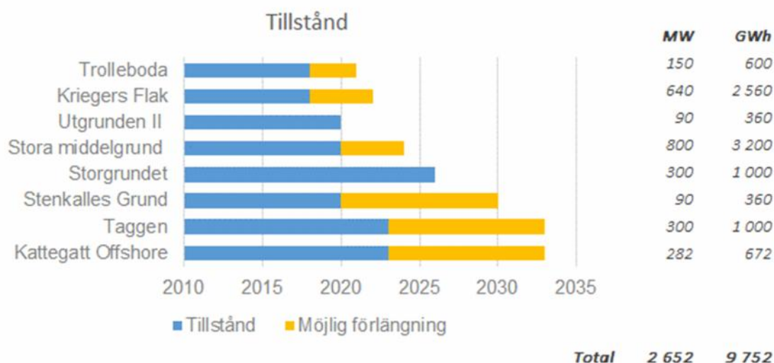
Figur 3: Befintliga svenska tillståndsgivna projekt. Sverige har god potential, men behöver agera för att ta den tillvara. Den blå stapeln markerar när tidsfristen för färdigställande går ut och den gula hur lång förlängning projekten som mest kan få.

Idag finns drygt 9 TWh tillståndsgivna vindkraftsprojekt i svenska farvatten och några inväntar tillstånd. De existerande tillstånden börjar dock förfalla, med start kring 2018-20236. Skulle detta, ske tappar man en stor del av potentialen och det blir svårt att få till stånd de erfarenheter som krävs för en utbyggnad i Sverige i perspektivet 2025-2035.