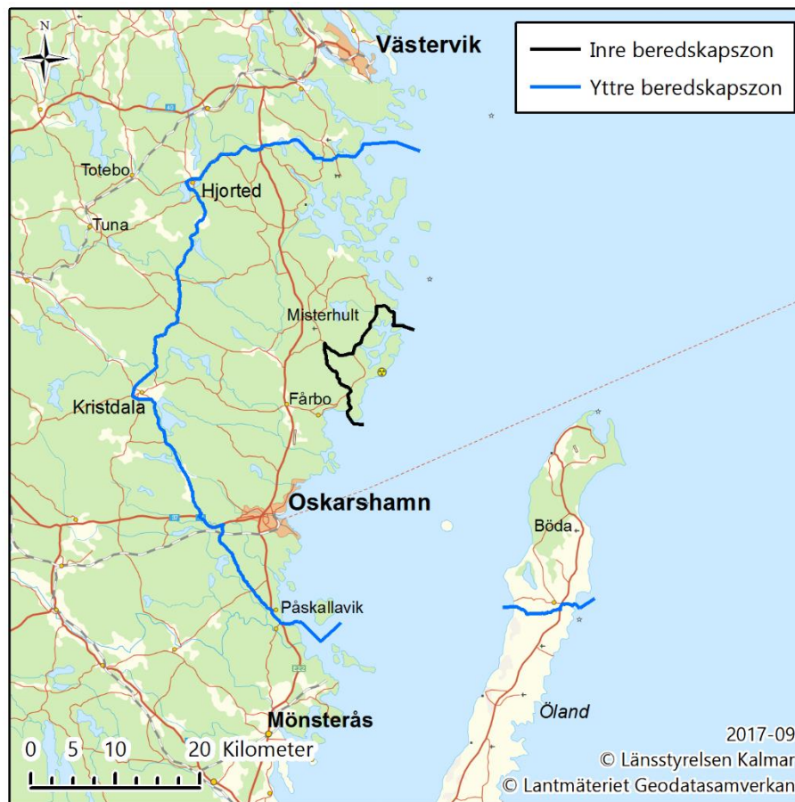
Figur 4. Förslag på inre och yttre beredskapszon kring kärnkraftverket i Oskarshamn.

Förslaget till inre och yttre beredskapszon kring kärnkraftverket i Oskarshamn redovisas i Figur 4.