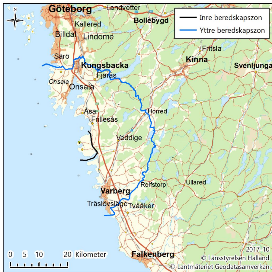
Figur 5. Förslag på inre och yttre beredskapszon kring kärnkraftverket i Ringhals.

Förslaget till inre och yttre beredskapszon kring kärnkraftverket i Ringhals redovisas i Figur 5.