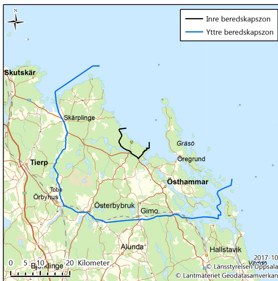
Figur 3. Förslag på inre och yttre beredskapszon kring kärnkraftverket i Forsmark.

Förslaget till inre och yttre beredskapszon kring kärnkraftverket i Forsmark redovisas i Figur 3.