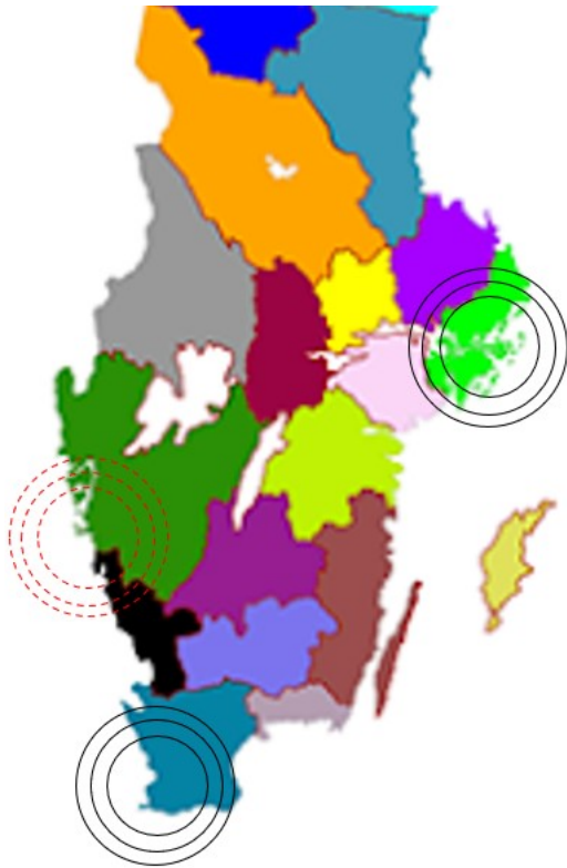
Figur 1. Sveriges tre starka ekonomiska motorer. Två är utpekade som regionplaneorgan