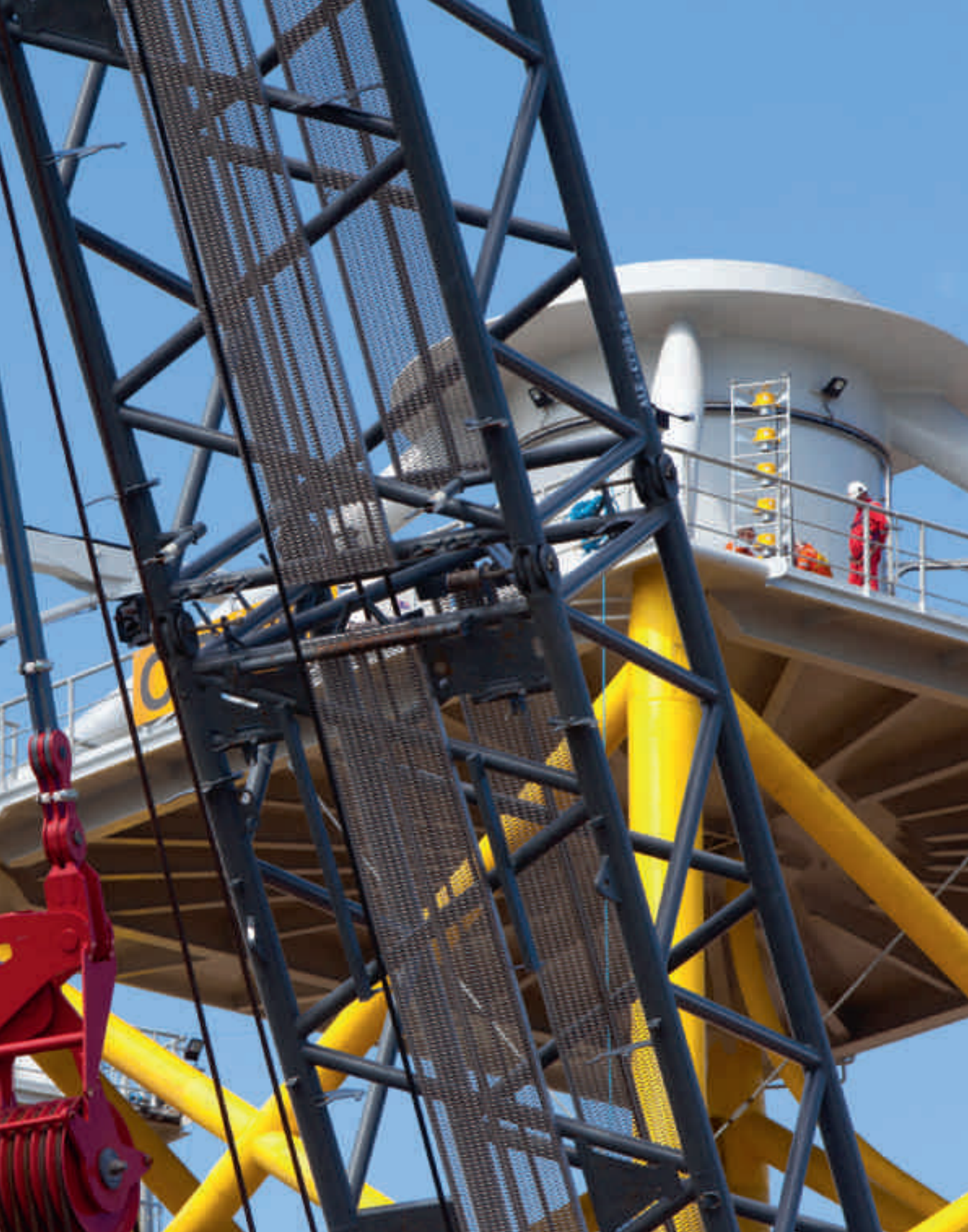
Installation av fundamenten till en av Vattenfalls stora vindkraftparker Ormonde i havet utanför nordvästra Englands kust.