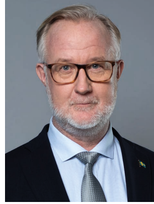
Johan Pehrson (L) Utbildningsminister Utbildningsdepartementet