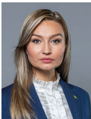
Ebba Busch (KD) Energi- och näringsminister och vice statsminister Klimat- och näringslivs- departementet