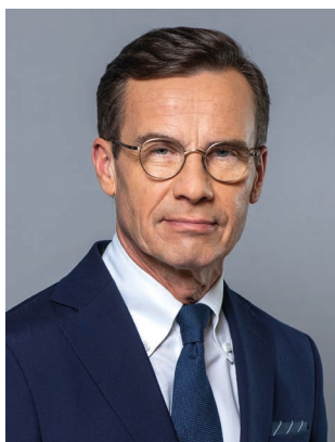
Ulf Kristersson (M) Statsminister Statsrådsberedningen