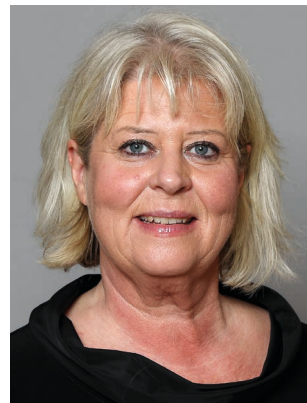
Camilla Waltersson Grönvall (M) Socialtjänstminister Socialdepartementet