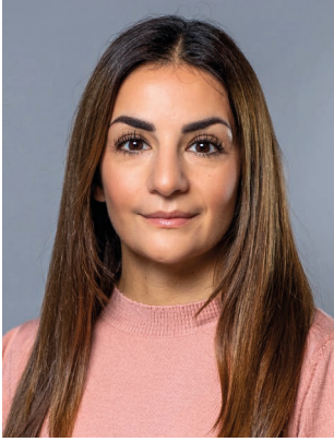
Parisa Liljestrand (M) Kulturminister Kulturdepartementet