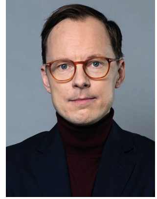
Mats Persson (L) Arbetsmarknads- och integrationsminister Arbetsmarknadsdepartementet