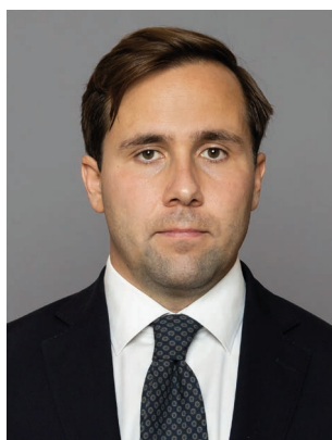
Benjamin Dousa (M) Bistånds- och utrikeshandels- minister Utrikesdepartementet