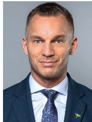
Erik Slottnér (KD) Civilminister Finansdepartementet