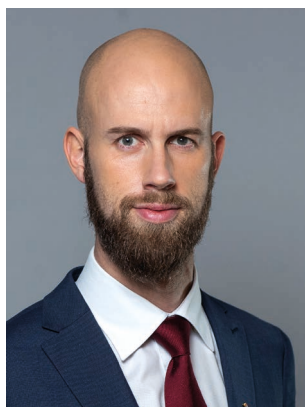
Carl-Oskar Bohlin (M) Minister för civilt försvar Försvarsdepartementet