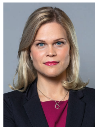
Paulina Brandberg (L) Jämställdhets- och arbetslivsminister Arbetsmarknadsdepartementet