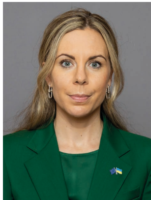
Jessica Rosencrantz (M) EU-minister Statsrådsberedningen