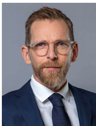
Jakob Forssmed (KD) Socialminister Socialdepartementet