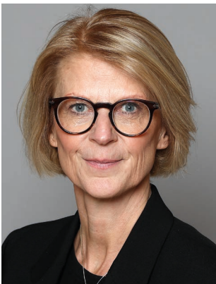
Elisabeth Svantesson (M) Finansminister Finansdepartementet