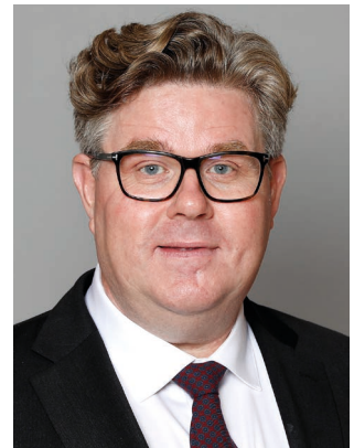
Gunnar Strömmer (M) Justitieminister Justitiedepartementet