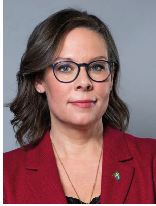
Maria Malmer Stenergard (M) Utrikesminister Utrikesdepartementet