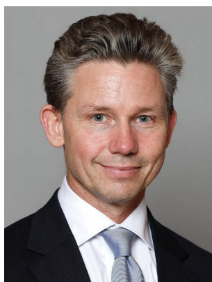
Pål Jonson (M) Försvarsminister Försvarsdepartementet