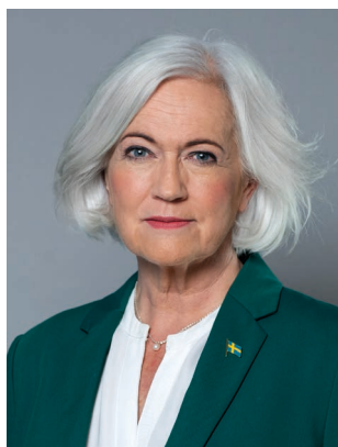
Acko Ankarberg Johansson (KD) Sjukvårdsminister Socialdepartementet