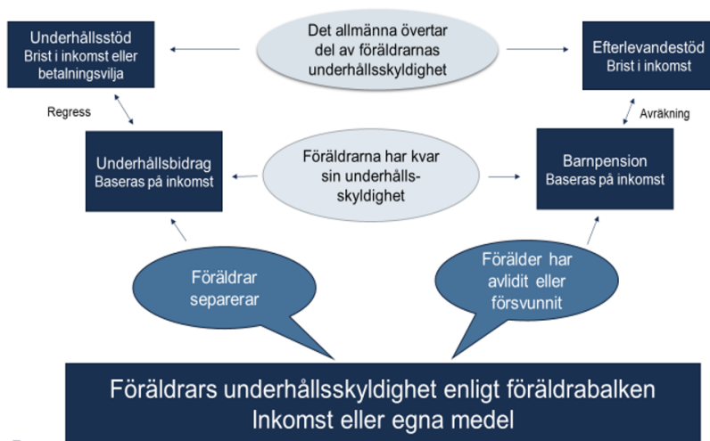
Figur 4.1 Struktur grundskydd till barn, vars föräldrar brister i sin underhållsskyldighet

Pensionsmyndigheten ansvarar för administrationen av efterlevandestödet. Bestämmelserna om efterlevandestöd finns i 76–79 kap. SFB.