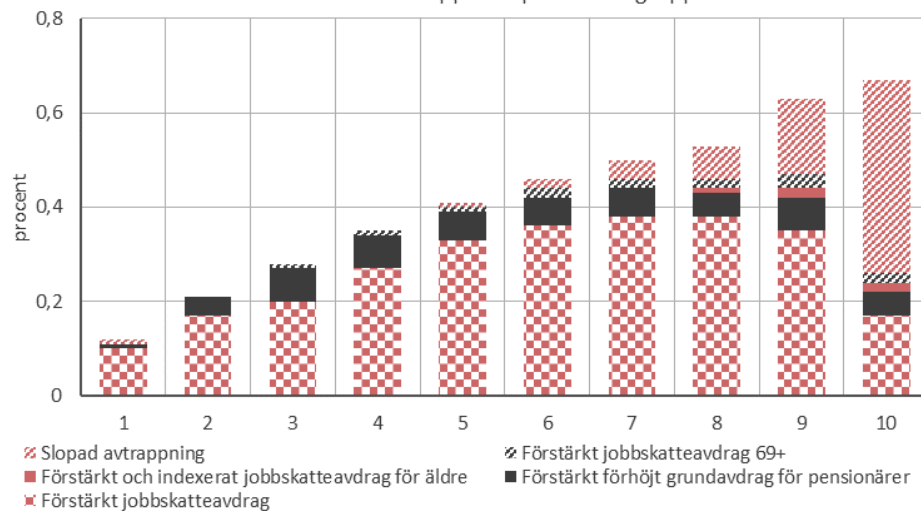
Diagram 1. Genomsnittlig effekt av promemorians samtliga förslag på ekonomisk standard uppdelat på inkomstgrupper

Den samlade effekten av de föreslagna skatteförändringarna innebär, som framkommer av diagram 1 nedan, att den genomsnittliga ekonomiska standarden förstärks avsevärt i toppen av inkomstfördelningen men endast marginellt i de lägre inkomstdecilerna. Förslagen i promemorian berör också fler män än kvinnor och ökar mäns genomsnittliga individuella inkomst mer än kvinnors. Av de 14,99 miljarder kronor i skattesänkningar som föreslås i promemorian går enligt våra skattningar runt 5,4 miljarder kronor till personer i den översta tiondelen av inkomstfördelningen (diagram 2); 2,6 miljarder kronor uppskattas gå till personer i den nedersta halvan av inkomstfördelningen. 1