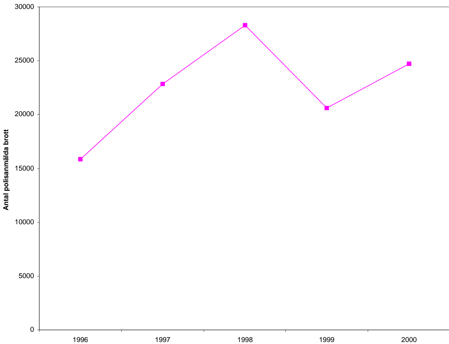
Figur 1. Antalet polisanmälda klotterbrott åren 1996-2000.