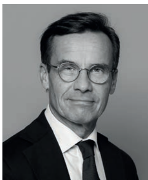
Ulf Kristersson Statsminister