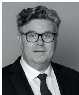
Gunnar Strömmer Justitieminister

genom insatser på fyra tydliga strategiska områden: Förebygga våldsbejakande extremism och terrorism. Förhindra terroristattentat och andra ideologiskt motiverade brott. Skydda samhällets människor och funktioner. Hantera situationen under och efter ett attentat.